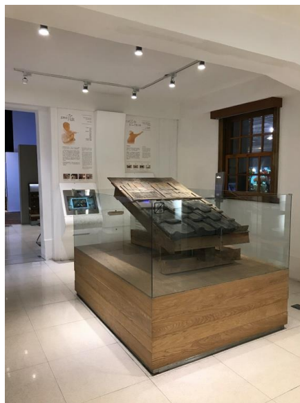
圖 3 南門館入口大廳古蹟修復常設展 圖 4 南門館 小白宮屋架模型