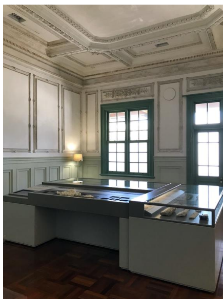
圖 5 鐵道部立體石膏飾展示區