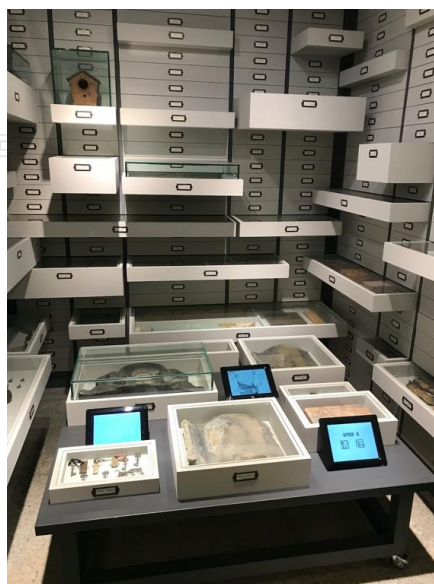
圖 6 鐵道部金庫展示區